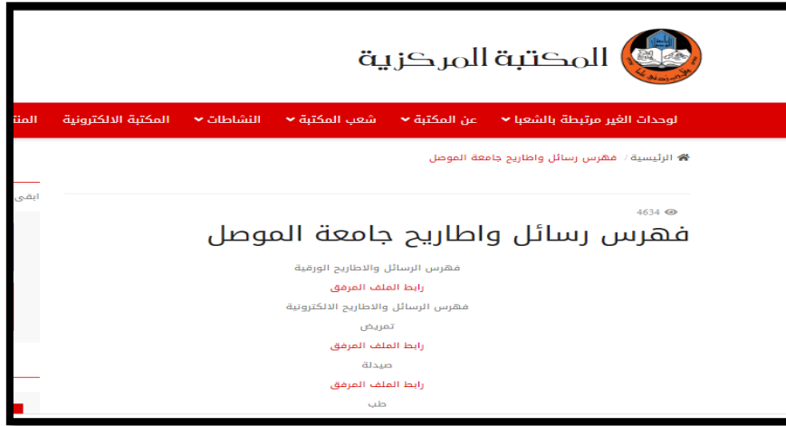
الشكل(٥) يمثل صورة فهرس الرسائل والاطاريح / جامعة الموصل

يوافر الموقع الالكتروني للمكتبة قوائم بالرسائل والاطاريح لجامعة الموصل بشكل PDF بعنوان ( فهرس رسائل والاطاريح جامعة الموصل الورقية والالكترونية ، وفهرس رسائل والاطاريح الجامعات العراقية والعربية ) والمعلومات التي توافرها ( اسم الطالب ، وعنوان الاطروحة ، واسم المشرف ، والشهادة ، والسنة ، والتخصص ) . والشكل(٥) يمثل صورة للفهرس. وأن الموقع الالكتروني للجامعة لا يوفر أي قاعدة بيانات بالرسائل والاطاريح الجامعية .