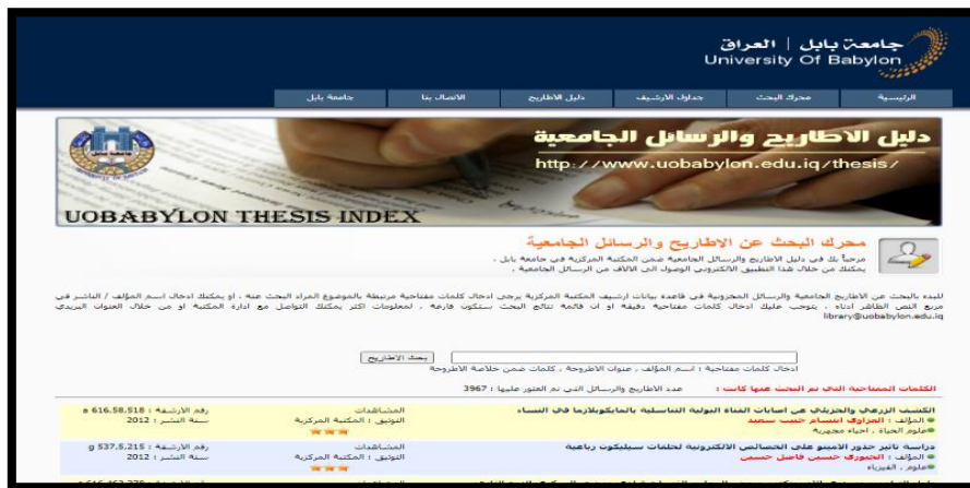
الشكل (٦) يمثل صورة لموقع دليل الاطاريح والرسائل الجامعية / جامعة بابل

توافر المكتبة عبر موقع الجامعة دليل الاطاريح والرسائل الجامعية ضمن قاعدة بيانات ببليوغرافية تحتوي على (٣٩٦٧ قيد ) لغاية ٣/١٨ / ٢٠٢١ والبيانات التي توافرها هي (العنوان ، واسم المؤلف ، وكلمات ضمن خلاصة الاطروحة او الرسالة ، والمشاهدات ، والتوثيق ، ورقم الارشفة ، و سنة النشر) ، و يوفر امكانية البحث ضمن العنوان واسم المؤلف و الكلمات الواردة ضمن الخلاصة. والشكل (٦) يمثل صورة لموقع الدليل .