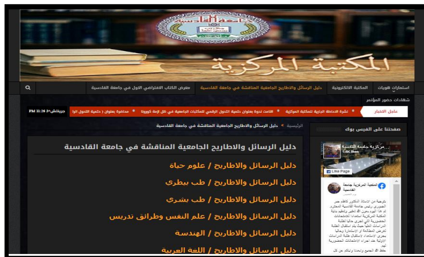
الشكل (٧) يمثل صورة لموقع الدليل الاطاريج والرسائل الجامعية / جامعة القادسية

يوافر موقع المكتبة المركزية للجامعة دليل بالرسائل والاطاريج الجامعية المناقشة في جامعة القادسية بشكل PPT مصنفة بحسب كليات الجامعة واقسامها (١٧ تخصص) . والشكل (٧) يمثل صورة لموقع الدليل .